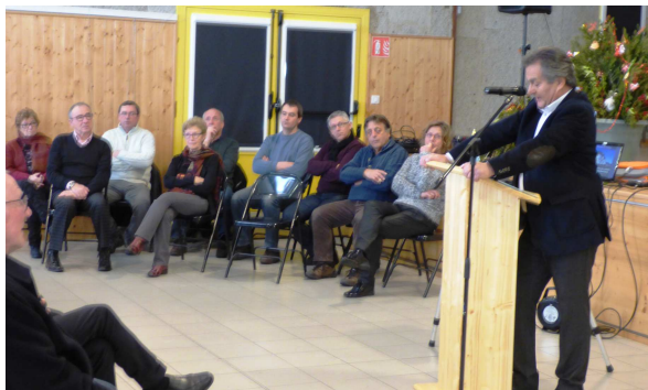
Le Maire et l'ensemble du conseil municipal

Le dimanche 8 janvier, les habitants de la commune sont venus nombreux écouter les vœux de la municipalité.