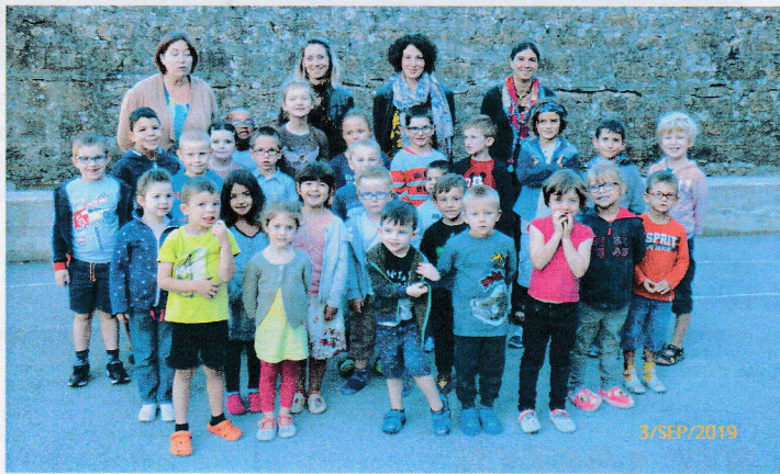
Les élèves des deux classes d'Aranc réunis

- L'école d'Aranc accueille 29 élèves répartis comme suit :