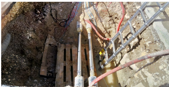
Tuyaux remplacés en inox