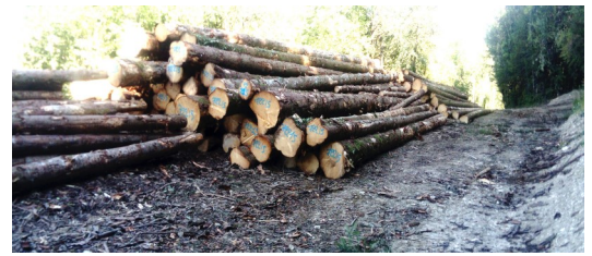
Place de dépôt piste de Marchat vers la fontaine à l'âne